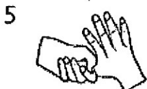
5 w czasie 5 sekund 5 ruchów