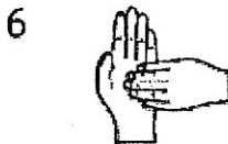
6 w czasie 5 sekund 5 ruchów

9. Dezynfekuj klamki oraz miejsca dotykowe kilka razy w ciągu dnia.