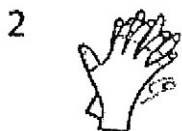
2 w czasie 5 sekund 5 ruchów