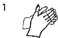
1 w czasie 5 sekund 5 ruchów

8. Nie zapominaj o częstym myciu rąk oraz dezynfekcji